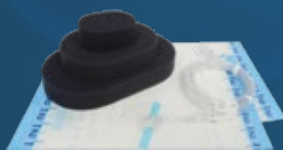
KIT DE APÓSITO (espuma / tubo / película)