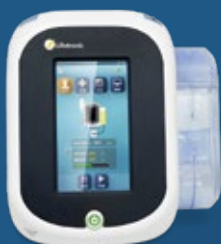
BOMBA DE ASPIRACIÓN